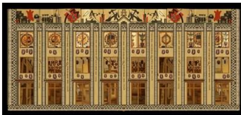
Momente de la Show 3D Mapping din orașul Gorna Oryahovitsa

În perioada 27-30 mai 2019, au fost realizate primele proiecții 3D pentru promovarea patrimoniului cultural și istoric din Gorna Oryahovitsa. La eveniment participă echipa municipiului Rosiori de Vede, reprezentanți ai mass-media, invitați ai orașului și alte părți interesate.